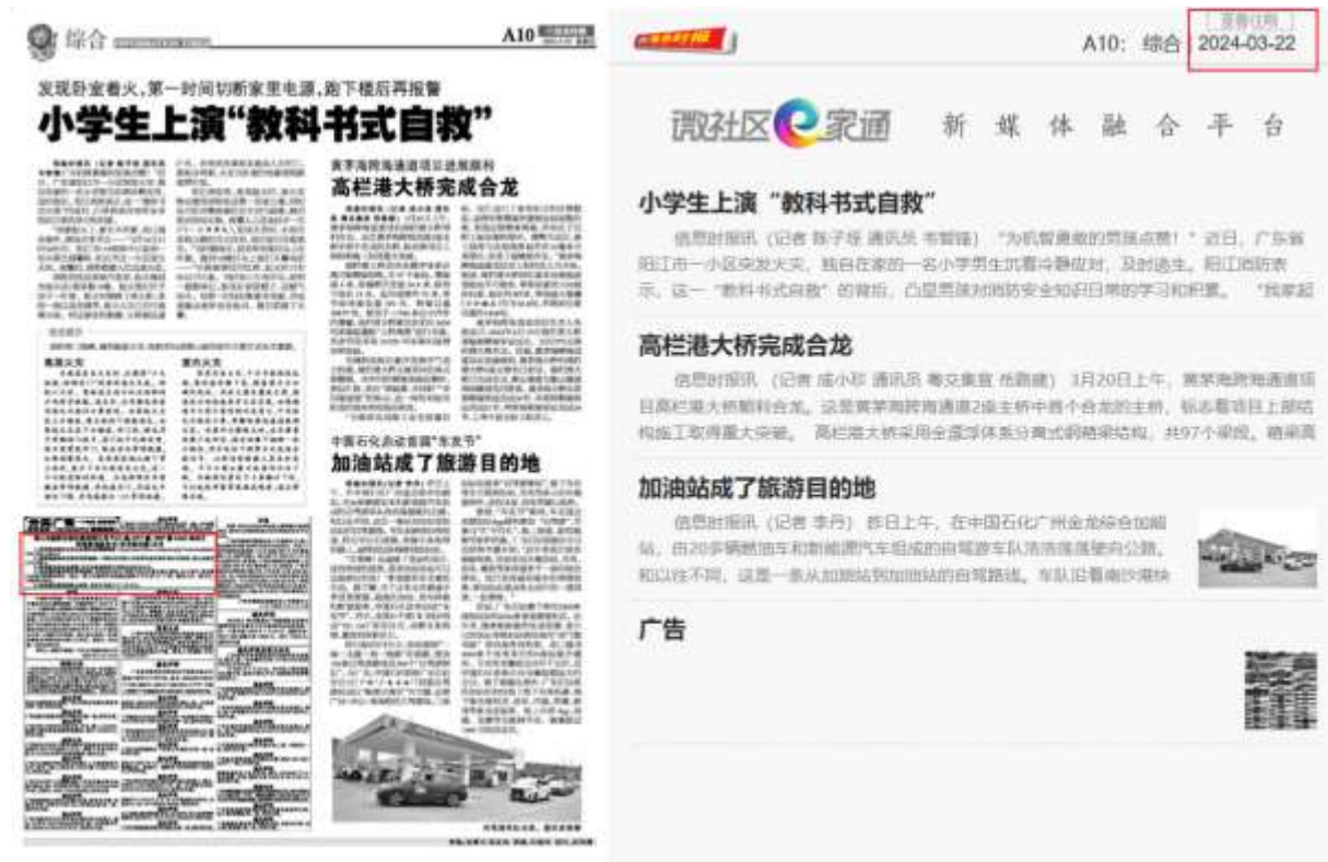
图 3 报纸公示截图（2024 年 3 月 22 日）

选取的报纸为建设项目所在地公众易于接触的报纸，且在征求意见的 10 个工作日内，公开信息 2 次，满足《环境影响评价公众参与办法》要求。