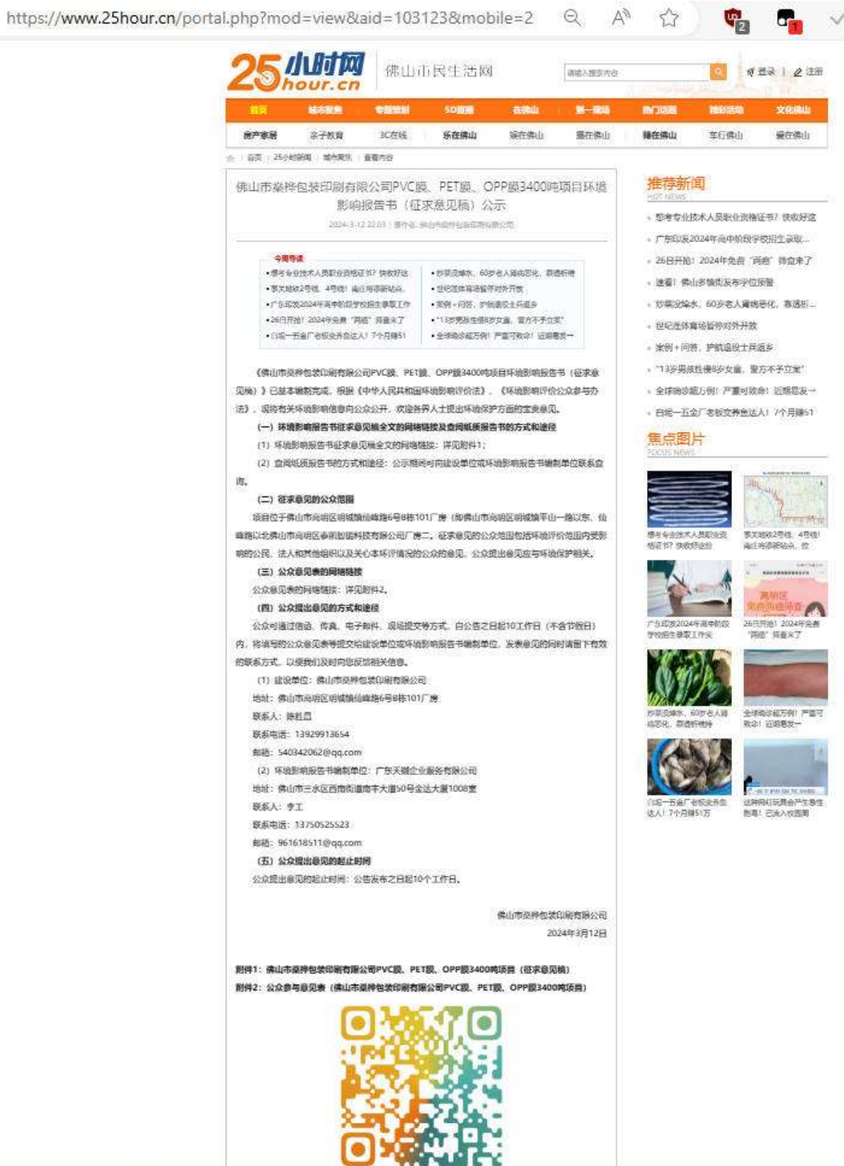
图2 项目征求意见稿网上公示截图