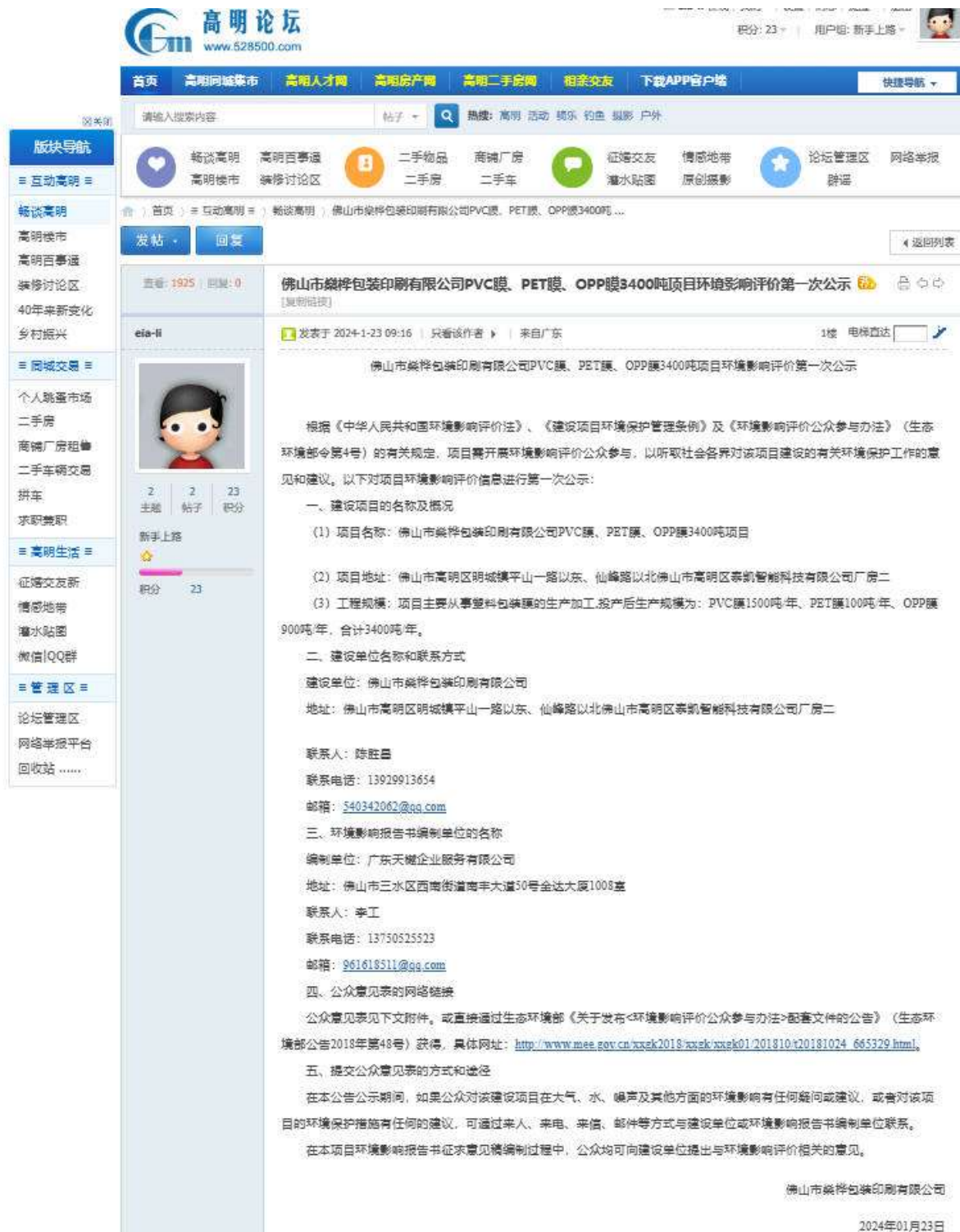
图 1 项目第一次网上公示截图