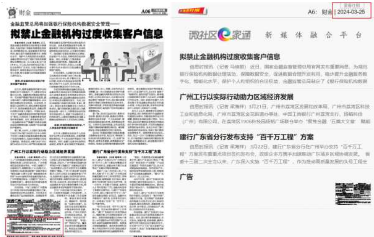
图 4 报纸公示截图（2024 年 3 月 25 日）