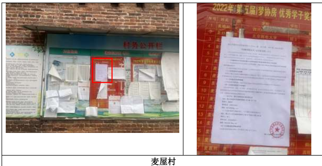
麦屋村 图5 项目第二次现场公示照片